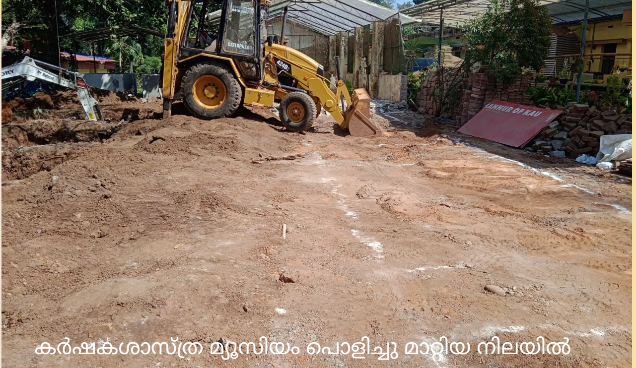
കർഷകശാസ്ത്ര മ്യൂസിയം പൊളിച്ചു മാറ്റിയ നിലയിൽ